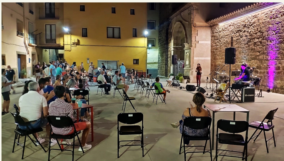
El festival "Secastilla Folk" contó con la actuación del grupo "Lugh" (julio 2020).