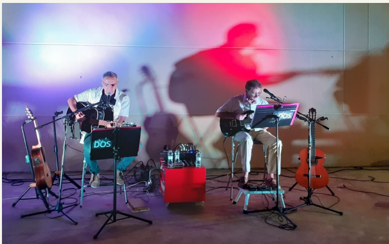
Actuación musical del dúo "Entre Dos" (julio 2020).

Mos pensabam que con la pandemia esta sección se quedaría chicota... ¡Pero aún puede ir! Un resumen en fotos de estos últimos meses, ane queda demostrau que a Secastilla no mos hem aburriu.