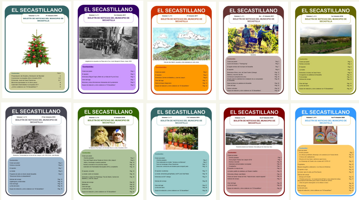
Archivo de portadas de los 10 primeros números de “El Secastillano”

Con este nuevo número de “El Secastillano” queremos inaugurar una nueva época. Hemos renovado el formato, incorporado nuevas secciones (“Cartas abiertas” p. 2, “Los de Antes, p. 26) y dejado otras atrás (“Cumpleaños”).