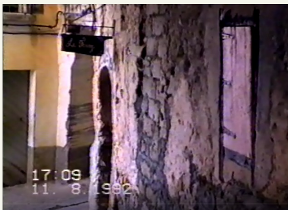
La entrada a la Ferre, tal y como se ve en un vídeo doméstico cedido por Casa el Fovano (1992)

La verdad es que para mí La Ferre ha significado mucho. Son muchas las horas que pasé allí durante los periodos vacacionales que estuve en Secastilla en mi adolescencia (más o menos desde finales de los ochenta). Supongo que los jóvenes de Secastilla y los veraneantes, encontramos un lugar de encuentro donde podíamos charlar, jugar a las cartas, escuchar música o echarnos unas risas.