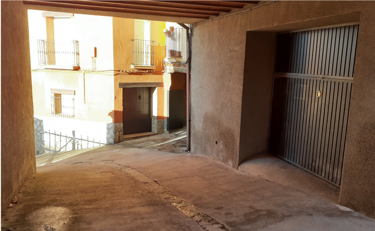
Hoy en día el espacio de La Ferre es un almacén del Ayuntamiento.