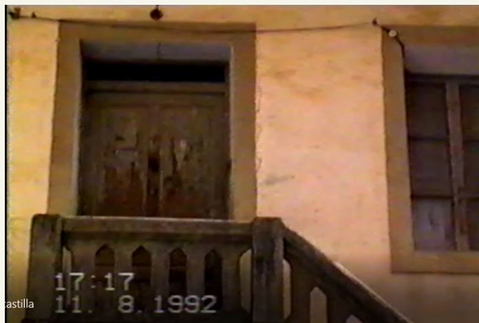
Acceso al antiguo ayuntamiento y salón de baile.

Va sé presidente y va dejá un superávit de 3 - 4.000 pesetas. Eba una sociedad informal, els que i acudiban aportaban y pagaban las consumicions a precio de coste.