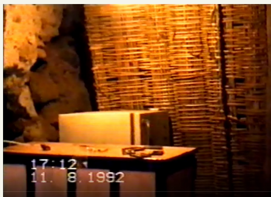
“La barra” de la Ferre, con la nevera con la que se equipó a principios de los 90.

No recuerdo de dónde salió, pero alguien trajo una nevera para poder tener algunos refrigerios fresquitos. ¡Eso sí fue una mejora! También llevaron una minicadena para escuchar música (de cassette, por supuesto). Montamos el cableado que iba a los altavoces y aquello nos sonaba mejor que en una discoteca. En la zona de la minicadena y la nevera también había una especie de barra hecha con un viejo mueble de madera que hacía que aquel rincón recordase a la zona en la que se pone el barman o el DJ en los bares. ¡Había que apañarse con lo que teníamos!