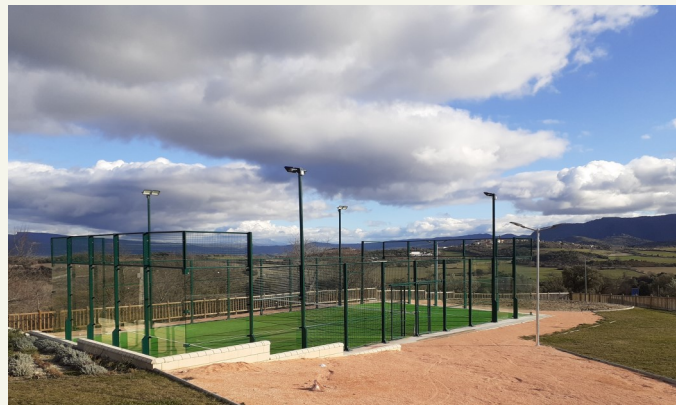
Nueva plaza y nuevo espacio público de recreo en Ubiergo.

Durante este año se han llevado a cabo una serie de reformas en el núcleo urbano de Ubiergo. Han consistido principalmente en acondicionamiento de diversos espacios para uso público. A continuación ofrecemos el detalle del gasto y de los importes subvencionados de estas intervenciones.