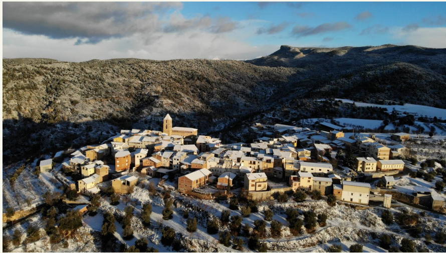
Secastilla tras una de las últimas nevadas (diciembre 2020)

BOLETÍN DE NOTICIAS DEL MUNICIPIO DE SECASTILLA