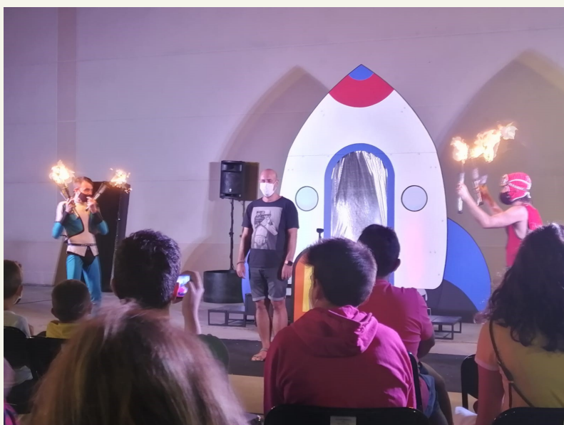
Continuamos con el Circo la Raspa, que nos acercaron las aventuras de Felpudoman y Escobilla (agosto 2020).